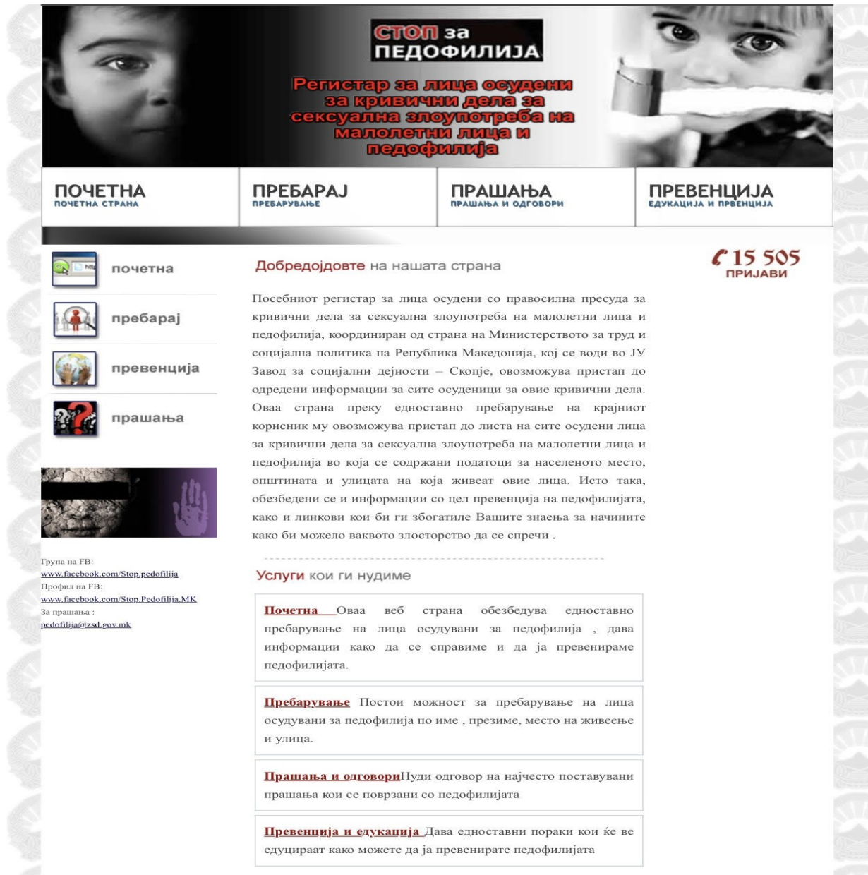
Фотографија 1. Ballina e web-faqes së Regjistrit të pedofilëve në RMV