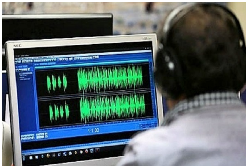
Fotografia 4. Personi i cili është përgjegjës për ndjekjen e komunikimeve

së komunikimit nga siguria dhe kualiteti i shërbimit të komunikacionit të cilat i janë mundësuar personit komunikimi i të cilit ndiqet. Agjencioni për komunikimet elektronike mundë të ngrëjë procedurë për mbikqyerje mbi operatorin, me kërkesë të organit të autorizuar për ndjekjen e komunikimeve.