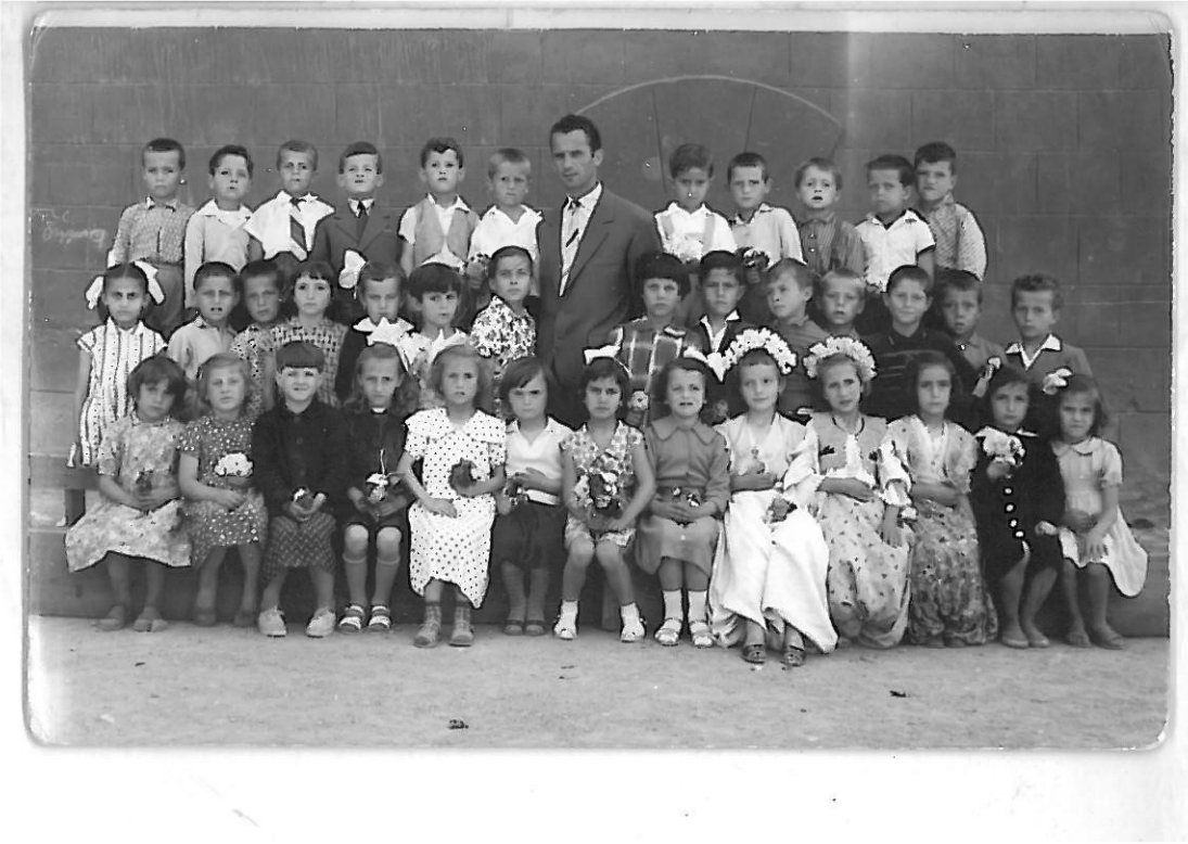
Foto 1. Fotografia e përbashkët e të gjitha paraleleve,ne fund të vitit shkollor,1960(Zhur)