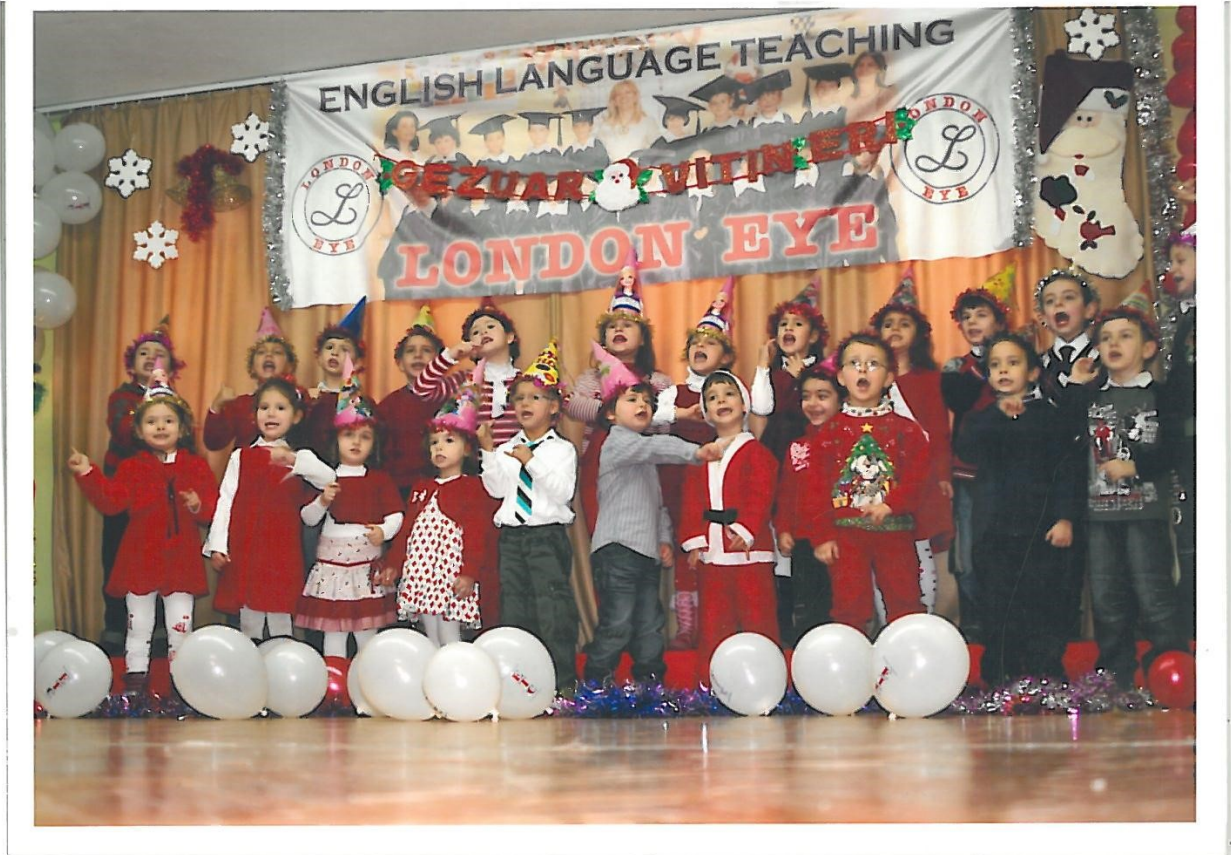
Foto 6. Programi I pergatitur nga parashkollorët për nder të festës së Vitit të Ri