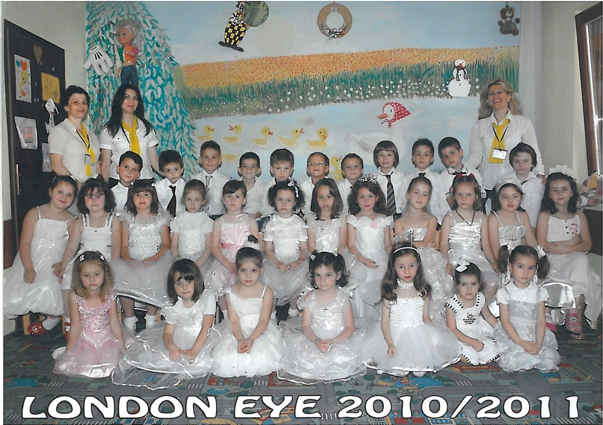
Foto 3.Perfundimi i parashkolloreve