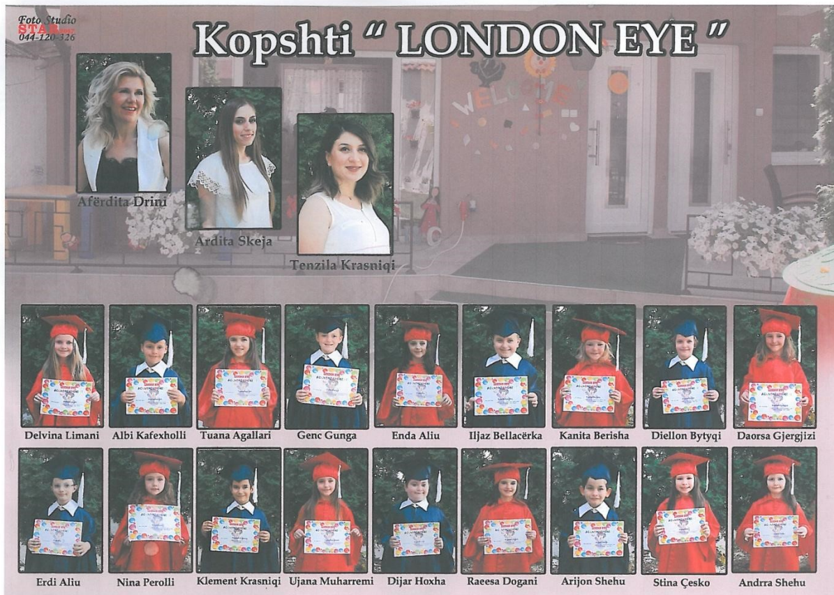
Foto 8. Panoja në fund të vitit shkollor 2016/2017